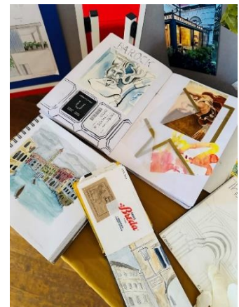
Die 13. Klasse

Diese unvergessliche Erfahrung wurde dank der großzügigen Unterstützung des Bau- und Fördervereins der Freien Waldorfschule Wetterau ermöglicht. Weitere beeindruckende Fotos zur Kunstfahrt und Vernissage finden Sie auch auf Instagram #waldorfschulewetterau .