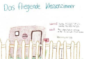
Die Klasse 8B